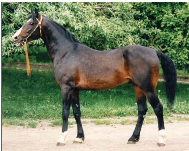
10842 ПОБОРНИК 2.03,0; 3.11,8; 4.19,9 гней, 1985 г., рожден в Чесменском конном заводе

9549 Букет 2.03,2 гн., 1969 гр. в Московском конном заводе