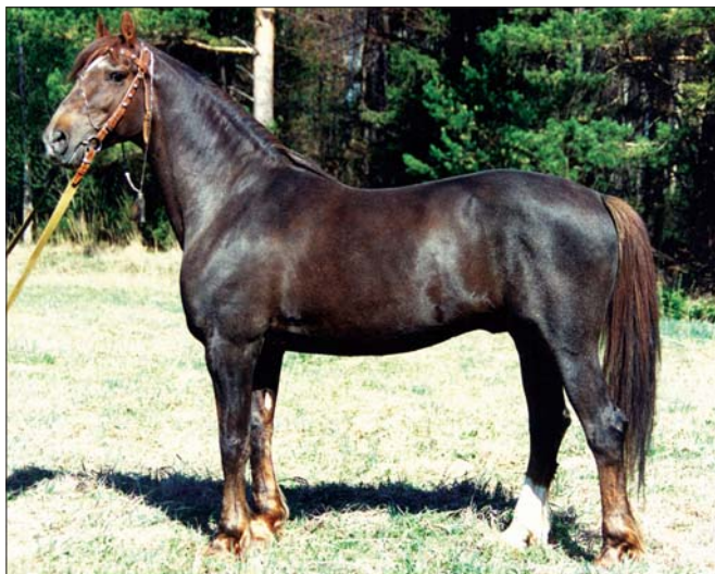
10616 КОВБОЙ 1.57,2; 3.06,8; 4.18,6 темно-рыжий в седину, 1984 г., рожден в Пермском конном заводе

10293 Блокпост 2.03,4 гн., 1977 гр. в Московском конном заводе